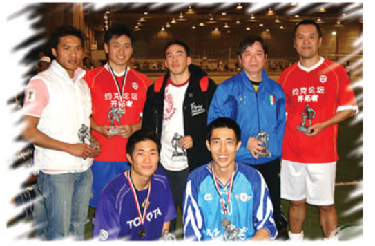
多元族裔球星活躍於社區

華人社區的足球運動更多依賴無數義工的辛勤工作，而大聯盟職業足球走進華人社區，將大大促進華人青少年足球人口的擴展，充實金字塔的基礎。更多訊息請訪美洲豹體育俱樂部網站 http://www.cougarking.com 。