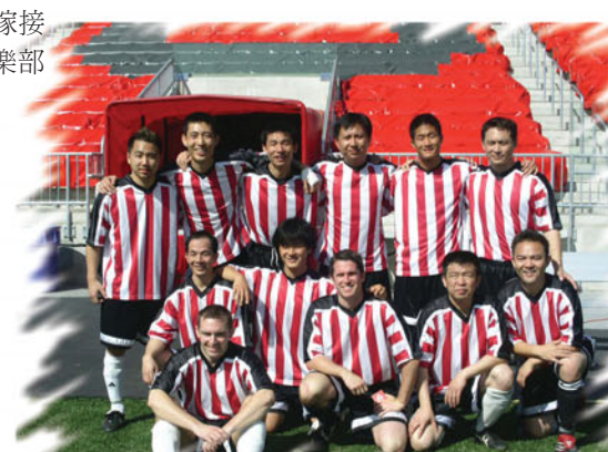
參加多倫多隊主場活動的美洲豹隊